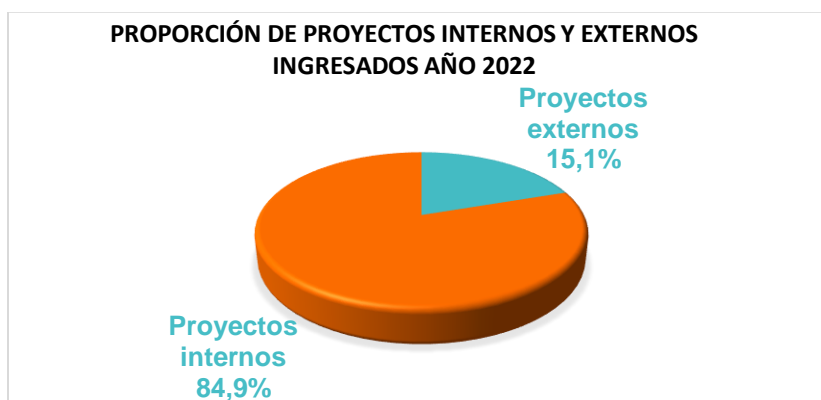
Gráfico 2: Proyectos internos y externos evaluados por el Comité de Ética Institucional 2022